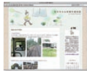
ブログ「ちりちゃんの寄り道日記」 http://digiso.exblog.jp/