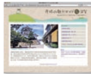
彦根の観光ガイド http://www.ds-j.com/guide/