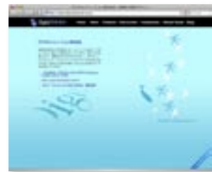
デジタルソリューション株式会社 http://www.ds-j.com